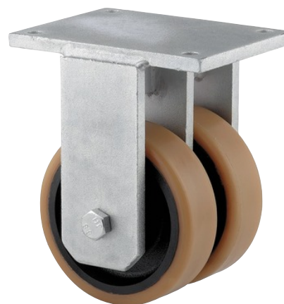
Obrázky se mohou lišit od skutečného produktu