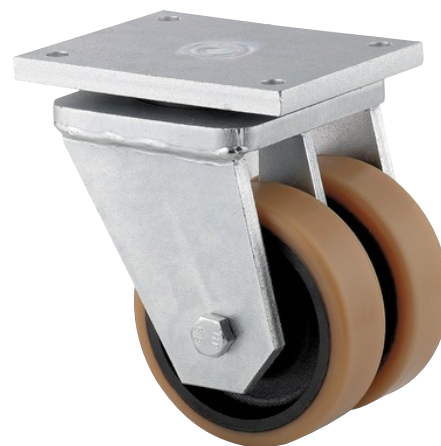
Obrázky se mohou lišit od skutečného produktu