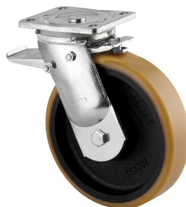
Obrázky se mohou lišit od skutečného produktu